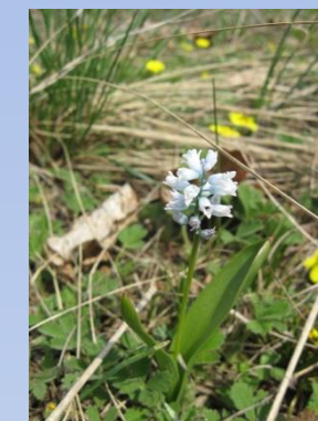
Zambilica Hyacinthella leucophaea