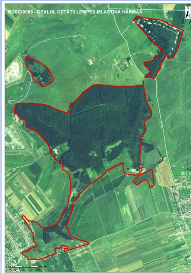
Harta sitului de importanță comunitară ROSCI 0055

Dealul Cetății (Lempeș) adăpostește în ochiurile de „stepă calcofilă” ale versantului său însoțit o serie de rarități floristice - migdalul pitic ( Amygdalus nana , syn. Prunus tenella ), frâsinelul ( Dictamnus albus ), zambilica ( Hyacinthella leucophaea ), Cytisus procumbens , Peucedanum arenarium ș.a., precum și specii neamenințate în prezent dar care pot deveni vulnerabile ca urmare a colectărilor, precum dedițelul ( Pulsatilla montana ), rușcuța de primăvară ( Adonis vernalis ) sau chiar coliliile ( Stipa sp. )