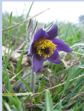
Dedițel Pulsatilla montana