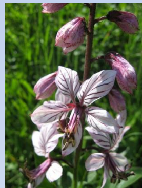
Frâsinel Dictamnus albus