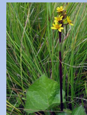
Curechi de munte Ligularia sibirica

Dealul Cetății (Lempeș) adăpostește în ochiurile de „stepă calcofilă” ale versantului său însoțit o serie de rarități floristice - migdalul pitic ( Amygdalus nana , syn. Prunus tenella ), frâsinelul ( Dictamnus albus ), zambilica ( Hyacinthella leucophaea ), Cytisus procumbens , Peucedanum arenarium ș.a., precum și specii neamenințate în prezent dar care pot deveni vulnerabile ca urmare a colectărilor, precum dedițelul ( Pulsatilla montana ), rușcuța de primăvară ( Adonis vernalis ) sau chiar coliliile ( Stipa sp. )