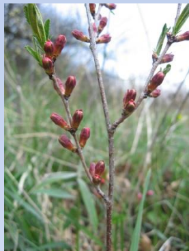
Migdal pitic Amygdalus nana

Mlaștina eutrofă de la Hărman prezintă o valoare conservativă deosebită ca urmare a prezenței unor relicte glaciare cum sunt curechiul de munte ( Ligularia sibirica ), specie inclusă în Anexa IIb a „Directivei Habitatare”, protejată și prin Convenția de la Berna sau endemitul – jimla Țării Bârsei ( Armeria maritima ssp. barcensis ), a unor specii vulnerabile/rare ca daria ( Pedicularis sceptrum carolinum ), ochii broaștei ( Primula farinosa ) sau rogozul ( Carex davalliana ) și altor rarități floristice - foaia grasă ( Pinguicula vulgaris ), Salix rosmarinifolia , Epipactis palustris . Restrângerea suprafețelor cu exces de umiditate ca urmare a scăderii debitului izvoarelor și a coborârii nivelului apei freatică prin realizarea de drenuri au determinat restrângerea drastică a unor comunități sau chiar dispariția altora, precum și foarte probabila extincție a unor specii periclitate – roua cerului ( Drosera longifolia ), Liparis loeselii și a altor plante rare precum trifoiștea ( Menyanthes trifoliata ), coada zmeului ( Calla palustris ) ș.a.