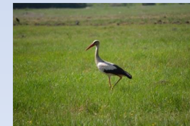
Barza alba - Ciconia ciconia

➤ Delimitarea și materializarea limitelor sitului ROSCI0055 și împrejmuirea cu gard viu a mlaștinii periclitată (habitat prioritar 7210*). ➤ Măsuri de ajutorare a regenerării pentru vegetația de silvostepă eurosiberiană cu Quercus sp din habitatul prioritar 9110*). ➤ Refacerea ecologică și conservarea mlaștinii Hărman, habitat prioritar 7210*. ➤ Reducerea impactului antropic asupra habitatelor prioritare din aria proiectului